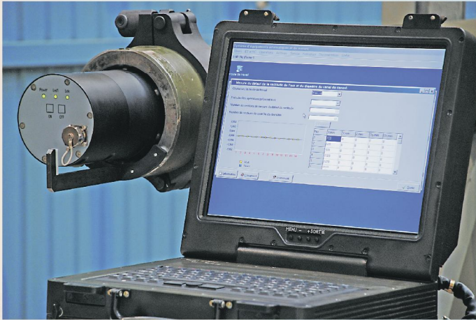
6-ти лучевой контроль внутреннего диаметра