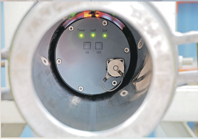
прибор перемещается по трубе автоматически